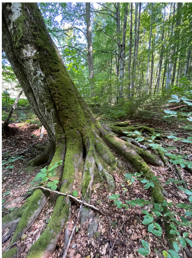
Рис. 3. Епіфітний покрив на стовбурі старого бука (Фельбаба-Клушина Л., 2023)

Lewinskya affinis (Schrad. ex Brid.) F.Lara, Garilleti & Goffinet, L. speciosa (Nees) F. Lara, Garilleti & Goffinet, Nyholmiella obtusifolia (Brid.) Holmen & E. Warncke, Orthotrichum patens Bruch ex Brid., Orthotrichum stramineum Hornsch. ex Brid., Ulotia crispa (Hedw.) Brid., Pulvigerella lyellii (Hook. & Taylor) Plášek, Sawicki & Ochuga, епіфіти Orthotrichum diaphanum Brid., Leucodon sciuroides (Hedw.) Schwägr., Isothecium alopecuroides (Lam. ex Dubois) Isov. Склад епіфітної бріофлори та ступінь розвитку мохового покриву залежить від виду і віку дерева та нахилу стовбура. Однак умови освітленості й вологості є визначальними, часто одні й ті ж форофіти в різних місцезростаннях характеризуються або високим видовим різноманіттям, або повною відсутністю епіфітів.