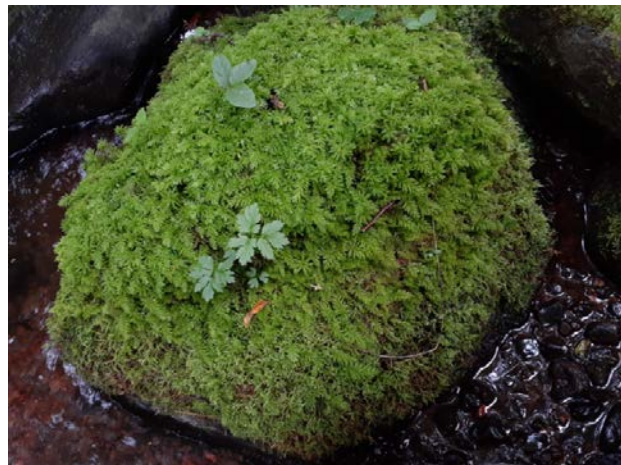
Рис. 1. Камінь вкритий мохами Plagiomnium undulatum і Thuidium delicatulum на березі притоки р. Іршави (Рабик І., 2023)

У букових та ялинових лісах епіфіти зростають на коренях або майже суцільно вкривають нижню частину стовбура (рис. 3): Dicranum montanum Hedw., Leskea polycarpa