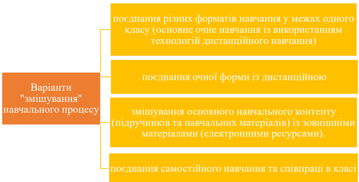
Схема 1. «Варіанти «змішування» навчального процесу»

Зокрема виділяють декілька видів так званого «змішування» навчання: [2]