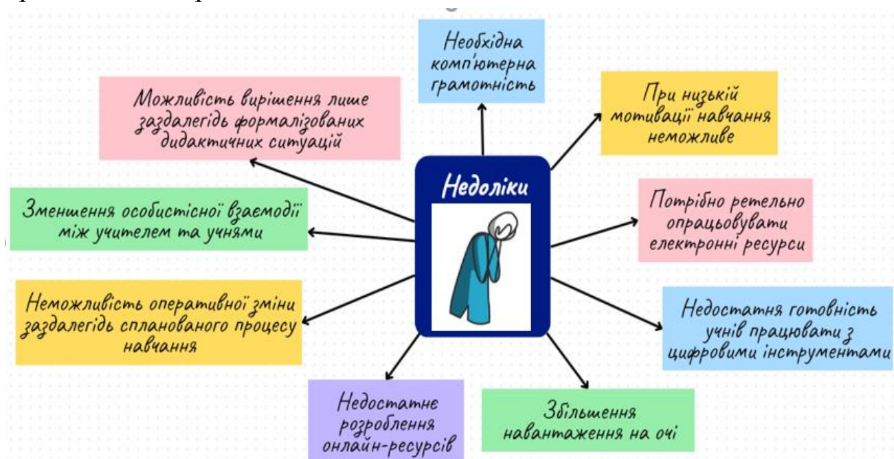
Рис. 2 «Недоліки змішаного навчання»

Водночас, ця форма організації навчання має певні недоліки, які не варто ігнорувати та над усуненням яких ще варто попрацювати, їх ми представимо на рис. 2.