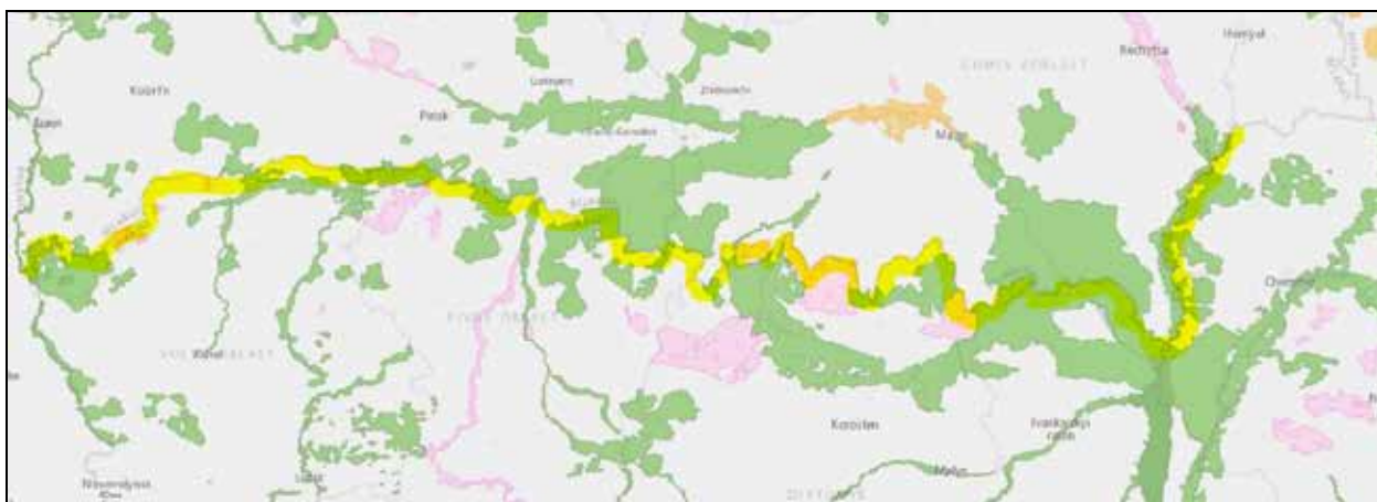
Рис. 5. Карта природних заповідних територій, розташованих уздовж українського кордону

Природні об'єкти, як-от ліси та болота у прикордонних районах, можуть слугувати потенційними щитами проти агресії, якщо їх належно охороняти та доглядати. Хоча 174,4 тисячі гектарів цієї смуги не входять у природно-заповідний фонд, їх можна було б додати до вже існуючих 120 тисяч гектарів охоронних зон. Збереження природних ландшафтів і боліт у Поліссі, які вже довели свою ефективність, коли російська військова техніка загрузла в болотах у 2022 р., може бути ключем до підвищення обороноздатності (Глухонець та ін., 2022). Обводнені та незруйновані природні території можуть відігравати вирішальну роль у захисті від потенційних загроз. І хоча ідея обводнення