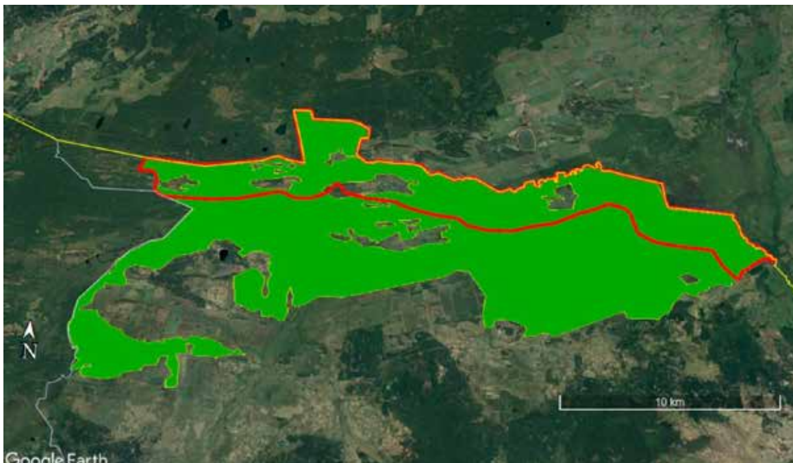
Рис. 6. Національний природний парк «Нобельський» і прилегла прикордонна зона (Толкаченко, 2022).

Військові конфлікти на сході України принесли низку викликів для НЗФ: від безпосереднього знищення природних об’єктів до втручання у природні екосистемні процеси. Натепер складно повноцінно виміряти обсяг цих збитків, ідентифікувати всі пошкоджені території та розробити стратегію для невідкладного реагування. Важливо негайно визначити й оцінити екологічні ризики, спричинені військовими діями, поінформувати суспільство про можливі наслідки та підготувати комплексний план відновлення. У контексті реконструкції країни після війни споживання природних ресурсів значно зросте. Військові операції та відбудовні заходи можуть призвести до збільшення викидів парникових газів, що ускладнить виконання Україною її кліматичних зобов’язань. Беручи до уваги можливий негативний вплив на довкілля, потрібно розробити систему екологічного моніторингу, щоби оцінити збитки та визначити план їх усунення для забезпечення добро-