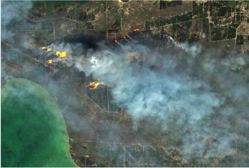
Рис. 3. Зафіксовані локації лісових пожеж на території Кінбурнської коси восени 2022 р. (Корчовий, 2023)

Шкідливі хімічні речовини після потрапляння у ґрунт дестабілізують його структуру. Міни та вибухи також спричиняють загибель багатьох диких тварин. Є стійка загроза появи нових пожеж унаслідок військових дій. Суха рослинність швидко запалюється, а пожежі стрімко поширюються. В окупованих районах важко здійснити протипожежні заходи. Місця з густими сосновими насадженнями на півночі та сході країни, а також в Чорнобильській зоні, є особливо сприятливими для поширення вогню. Пожежі завдають шкоди екосистемам, причому негативні наслідки мають спільні особливості: величезна кількість рослин і тварин гине, атмосфера зазнає забруднення у вигляді різних шкідливих сполук і викидів \text{CO}_2 (Shvedun et al., 2023).