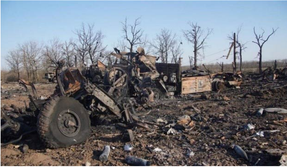
Рис. 4. Приклади взаємодії військових впливів, спричинених руйнівними діями боєприпасів і наслідками забруднення техніки, палинками та вибуховими речовинами на території ПЗ України (Kolodezhna et al., 2022)

Коли зазначені шкідливі речовини потрапляють у землю та підземні води, вони можуть рухатися далі до річок і озер, накопичуватись у тілах живих істот і становити загрозу для їхнього здоров'я або навіть життя. Водні організми, особливо ті, які проводять багато часу у водоймах, є найбільш уразливими до цього забруднення, як-от різноманітні риби або водоплавні птахи. Біологічне накопичення отруйних речовин відбувається через процес біомагніфікації, коли з кожним наступним рівнем у харчовому ланцюзі концентрація отруйних речовин стає вищою. Це може призвести до того, що види на верхівці харчової піраміди, як-от хижак або навіть людина, стануть найбільш уразливими до цих забруднювачів.