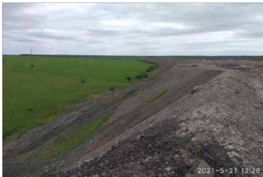
Рис. 2. Вигляд відпрацьованої ділянки породного відвалу

новживані методи трансектного та точкового обліків.