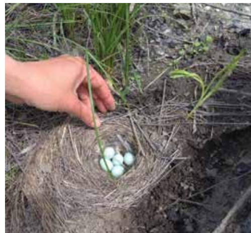
Рис. 5. Гнізда кам'янки звичайної ( Oenanthe oenanthe ) з насидженими яйцями на плато породного відвалу шахти ім. М.І. Сташкова