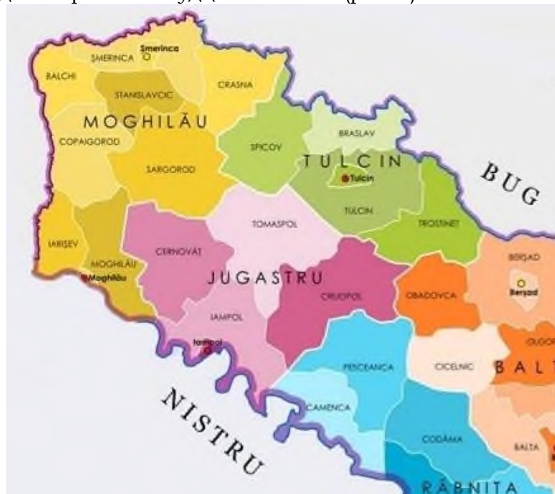
Рис. 2. Фрагмент карти «Трансністрія» (Левченко, 2015)

поділявся на вісім пласів (Могилівський, Яришівський, Шаргородський, Станіславчицький, Копайгородський, Болкхський, Краснянський і Жмеринський) та два міста із самоуправлінням – Могилів (центр жудця й місце перебування префекта) і Жмеринку. Могилівський жудць мав таку ж кількість територіальних одиниць як і Балтський, чим обидва вигідно виділялися на тлі інших. Цікаво, що у дисертаційному дослідженні Левченко Ю. І. чомусь посилається лише на шість пласів (Левченко, 2015). Зовсім не згадує Могилівський та Болкхський пласи, а також міста як території з особливим статусом. При цьому, карта, на яку посилається автор, свідчить про інше (рис. 2).