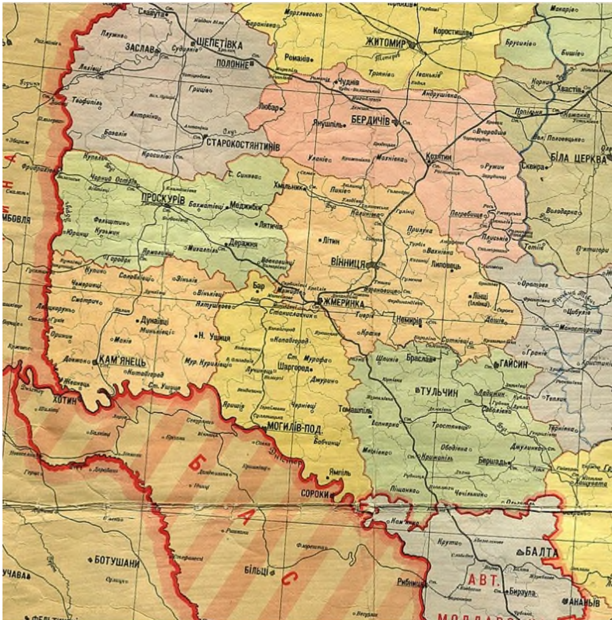
Рис. 1. Карта Могилівської округи, адміністративні межі станом на 1 березня 1927 (Територія колишньої Подільської губернії ..., 1927)

У 1937 році з утворенням Кам'янець-Подільської та Житомирської областей округи були ліквідовані, а з тим припинив функціонувати і Яришівський район, який увійшов до складу Могилів-Подільського району. Місто ж Могилів-Подільський із 1937 року набуває статусу обласного значення. У Вінницькій області на той час лише м. Вінниця мала обласне підпорядкування.