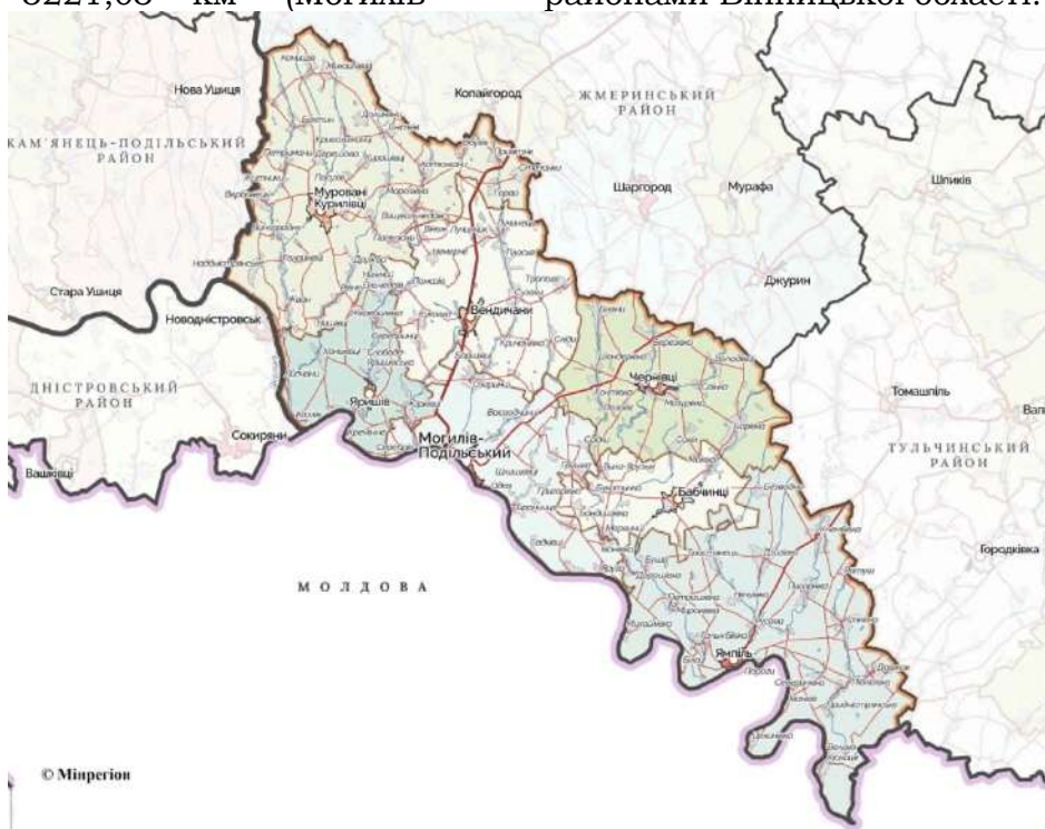
Рис. 4. Територіальні громади Могилів-Подільського району Вінницької області (Могилів-Подільський район)

Подільський район, 2020). До цього району увійшло сім територіальних громад (2 міських, 3 селищних та двох сільських; рис. 4, табл. 2 ) у складі 195 населених пунктів (2 міст, 3 селищ і 190 сіл та селищ). Чисельність населення становить 144 647 осіб та є найменшою у порівнянні з іншими районами Вінницької області.