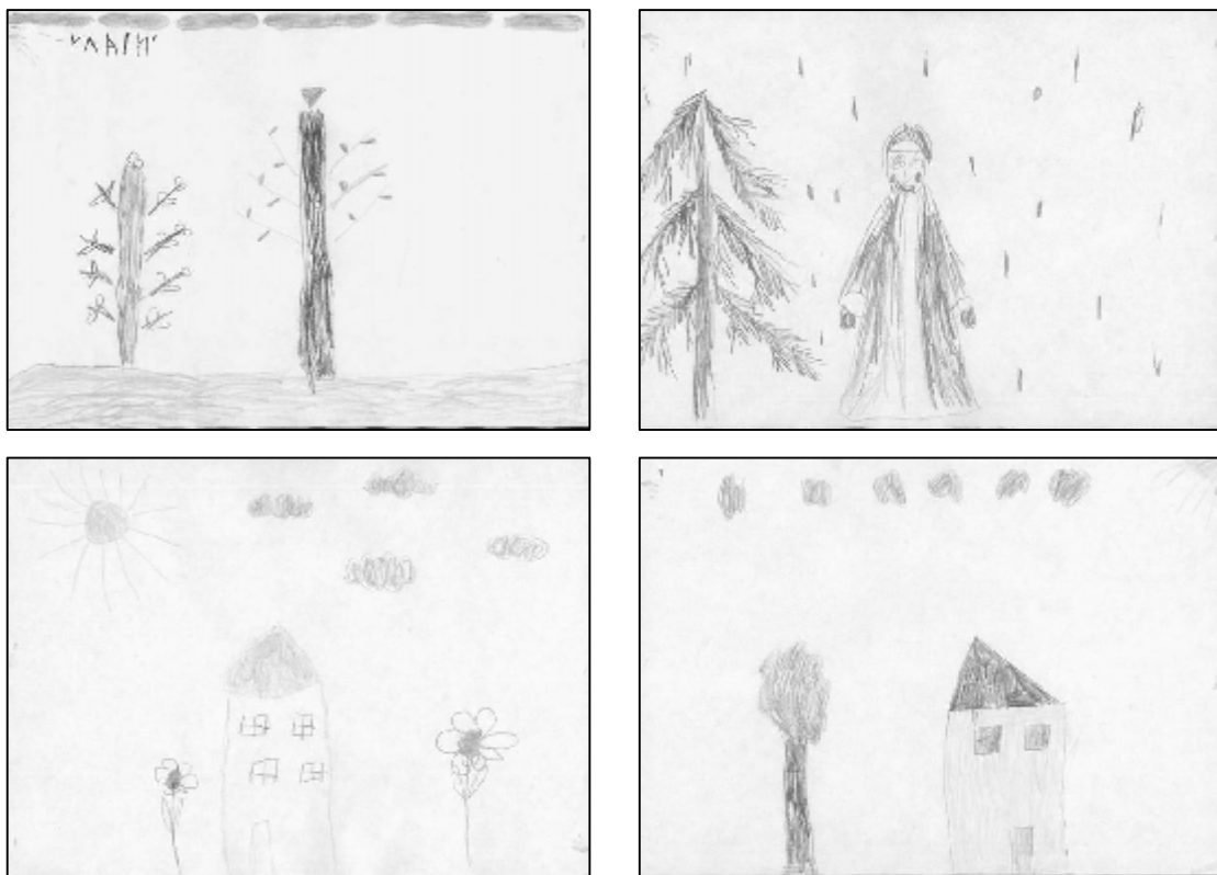
Рис. 1. Малюнки дітей першої групи (тих, яким не обіцялася ніяка винагорода)

На рис. 1. наведено декілька малюнків дітей першої групи (тих, яким не обіцяли ніякої винагороди), а на рис. 2 – декілька малюнків дітей другої групи (тих, яким обіцяли за малювання цукерки).