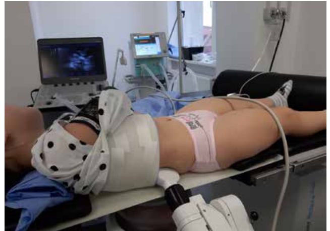
Рис. 2. Екстракорпоральна ударнохвильова літотрипсія конкремента нирки пацієнтці віком 2 роки

мента. У 2 (40%) хворих ставили питання щодо інструментальних методів видалення каменів із сечових шляхів.