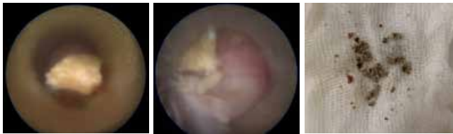
Рис. 4. Відмивання дрібних фрагментів із порожнистої системи нирки

та екстракцію за допомогою кошика Dormia або щипців для захоплення фрагментів.