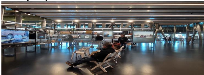
Рисунок 2. Внутрішній простір Музею середземноморських цивілізацій у Марселі

Наративи Музею середземноморських цивілізацій у Марселі присвячені країнам Середземномор'я, здійснюючи внесок у постійний діалог населення цього регіону. У центрі музейного наративу – середземноморські цивілізації, а також зв'язки регіону з Європою. Музей містить постійну і тимчасові експозиції, дослідницький центр, організовує наукові конференції.