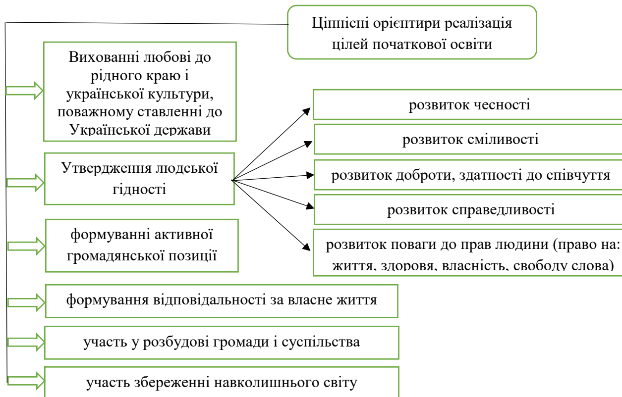
Рис. 2. Базові ціннісні орієнтири реалізація цілей початкової освіти які передбачено Державним стандартом початкової освіти