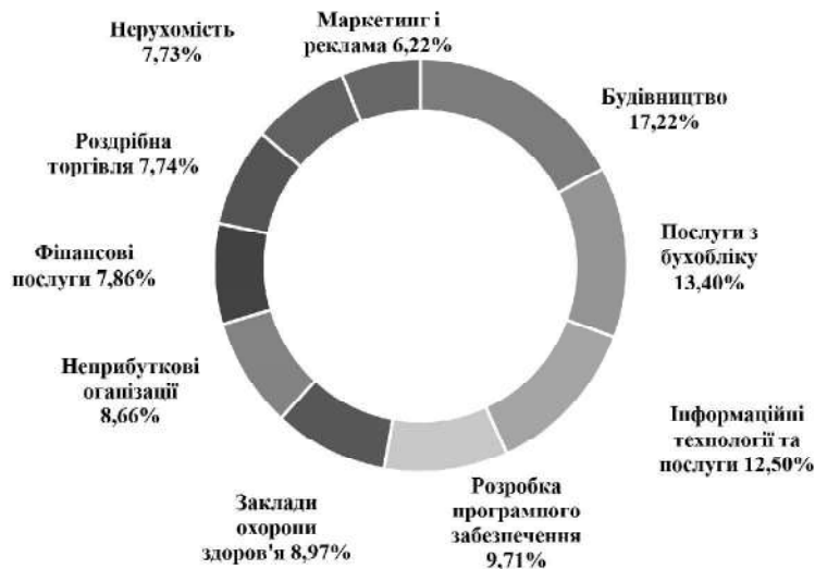
Рис. 2. Частка користувачів QuickBooks по секторах економіки