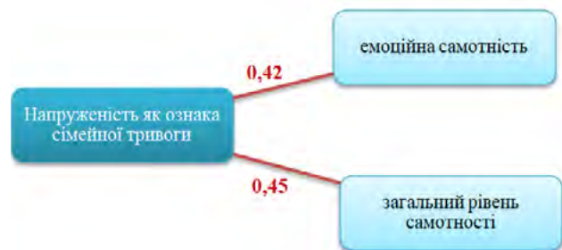
Рис. 2. Взаємозв'язок між напруженістю як ознакою сімейної тривоги та шкалами самотності (група з підвищеним рівнем сімейної тривоги)

Напруженість як ознака сімейної тривоги прямо корелює з емоційною самотністю та загальним рівнем самотності (рис. 2). У цьому випадку напруженість виступає тригером для емоційної самотності, з якою підвищується загальний рівень самотності. Шкали «Вини» ( r=-0,52 ), «Напруженості» ( r=-0,44 ) та «Рівня загальної сімейної тривоги» ( r=-0,46 ) обернено корелюють зі шкалою «Спогадів про тепло та безпеку». Підвищені показники за цією шкалою вказують на приємні та хороші спогади з дитинства. Відштовхуючись від результату аналізу, можна зробити висновок про те, що при теплих дитячих спогадах знижується почуття вини, напруженості та загальної тривоги.