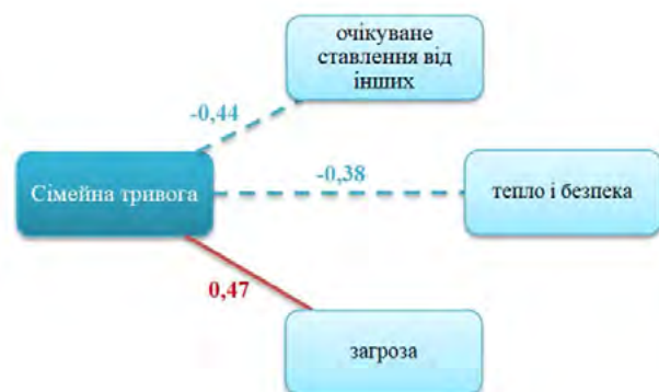
Рис. 3. Взаємозв'язок між сімейною тривогою та шкалами самоствавлення, раннього дитячого досвіду (група із середнім рівнем сімейної тривоги)

Ці результати свідчать про те, що напруженість підвищується, якщо сім'я неповна, і якщо вони проживають в обласному центрі, то рівень загальної сімейної тривоги спадає. На відміну