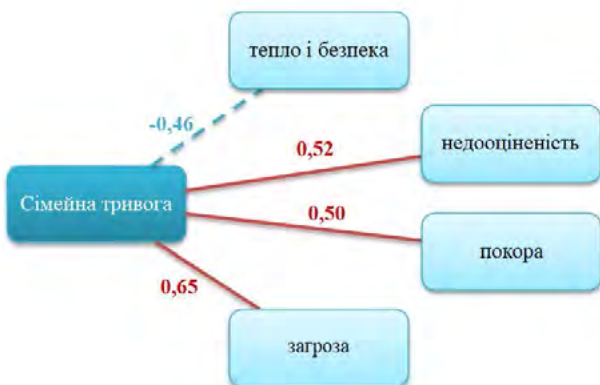
Рис. 1. Взаємозв'язок між сімейною тривогою та ранніми дитячими спогадами (група з підвищеним рівнем сімейної тривоги)

Виявлені взаємозв'язки сімейної тривоги зі шкалами, які визначають рівень спогадів про тепло і безпеку, рівень недооціненості, покори та загрози. Непрямий зв'язок між теплом і безпекою та сімейною тривогою свідчить про те, що почуття емоційної підтримки та захищеності у сім'ї відіграє важливу роль у зниженні рівня тривожності у членів родини. Тепло і безпека, які індивід отримує у дитинстві, формують фундамент для розвитку довіри та емоційної стабільності, що надалі сприяє більш ефективному подоланню стресових ситуацій і конфліктів у дорослому віці. Окрім цього, результати прямого зв'язку між сімейною тривогою та почуттями недооціненості, загрози та покори свідчать, що коли особи цієї групи відчувають себе знеціненими, пригніченими або відчувають небезпеку у контексті сімейних стосунків, їхній рівень тривожності зростає (рис. 1).