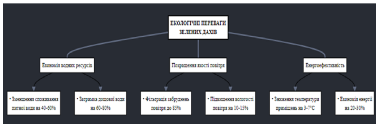
Рис. 3. Екологічні переваги зелених дахів

Важливо відзначити, що зелені дахи з системою повторного використання сірої води створюють нові екосистеми в міському середовищі, підтримуючи біорізноманіття та забезпечуючи середовище існування для різних видів. Вони також відіграють