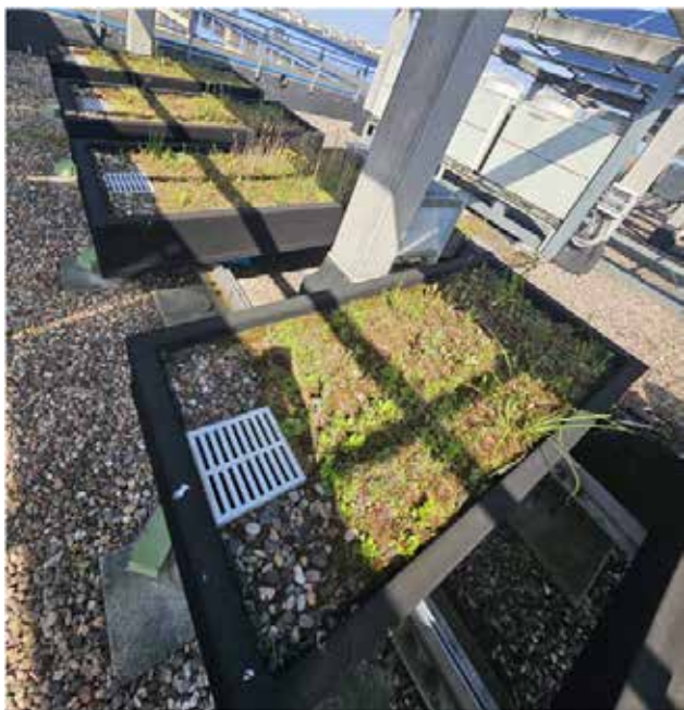
Рис. 1. Експериментальна установка

механічну фільтрацію (20 мкм), біологічну очистку з використанням аеробних бактерій, UV-стерилізацію, систему контролю якості води в реальному часі.