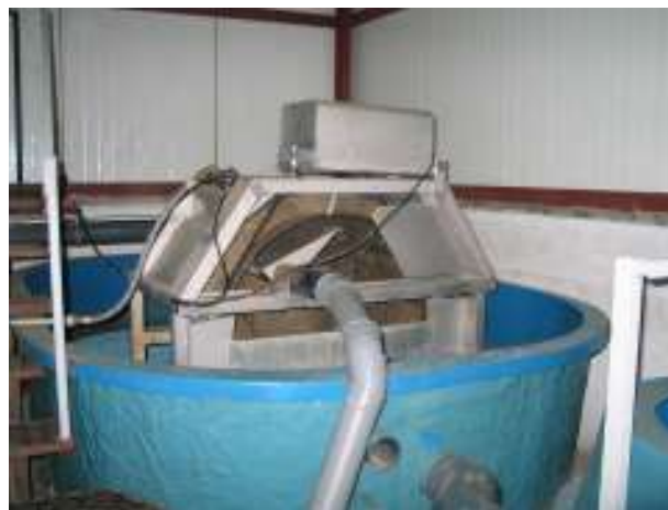
Рис. 2. Механічний фільтр ООО “Аквапромгруп”

Дослідження проводилось на одній з ферм з вирощування кларієвого сома, яка входить до спілки аквафермерів України ООО “Аквапромгруп”, що в Одеській області. Господарство неповносистемне.