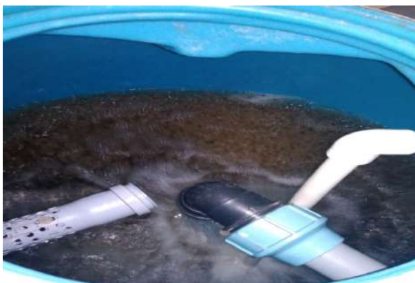
Рис. 4. Біологічний фільтр “Аквапромгруп”

Малька закупляють. Процес вирощування товарного кларієвого сома відбувається за рибоводно-біологічними показниками, наведеними у табл. 1.