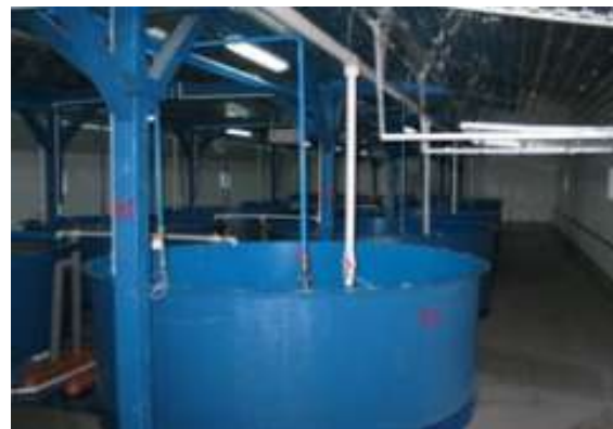
Рис. 3. Басейновий комплекс ООО “Аквапромгруп”