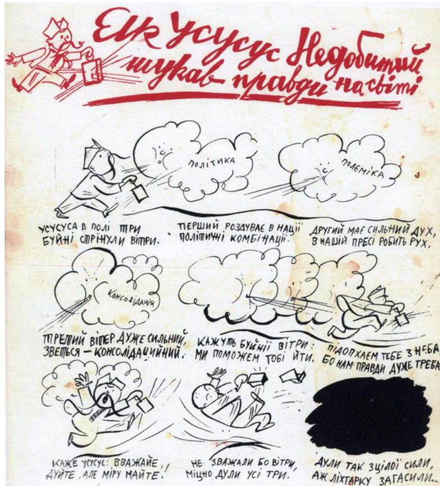
Рис. 1. Перший український комікс «Як Усусус Недобитий шукав правди на світі»

Пізніше, цей автор створив та опублікував ще один комікс «Лис Микита в Америці» (журнал «Лис Микита», місто Детройт, 1955 р.). Інший відомий автор Л. Перфецький, у 1953 р. в часописі «Америка» (Філадельфія) надрукував серію коміксів-розповідей «Україна в боротьбі з наїзниками», які пізніше кілька разів передруковувались закордоном, проте в Україні були заборонені.