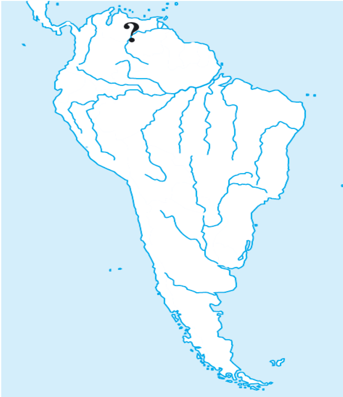
Рис. 1 Картосхема Південної Америки