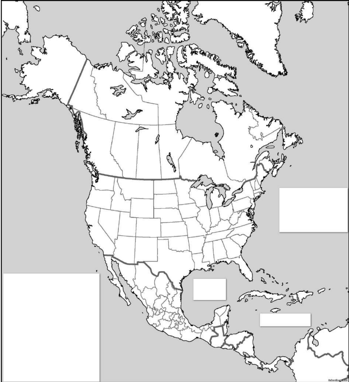
Рис. 1 Картосхема Північної Америки

Завдання 4. Нанести на картосхему об'єкти нематеріальної культурної спадщини ЮНЕСКО в країнах Північної Америки.