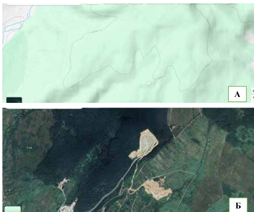
Рис. 3. Ландшафтна карта із зображенням висоти 300 м над рівнем моря, що проходить поблизу Сокирницького кар'єру цеолітів Хустського району Закарпатської області (А), та ж місцевість на гугл-карті (Б) ( https://www.google.com/maps/@48.1431631,23.4050793,2022m/data )

У низині переважають островні ліси дуба звичайного ( Quercus robur L.) із грабом звичайним ( Carpinus betulus L.), рідше з ясенем звичайним ( Fraxinus excelsior L.), трапляються окремі локалітети береста, або в'яза граболистого ( Ulmus minor Mill.), клена