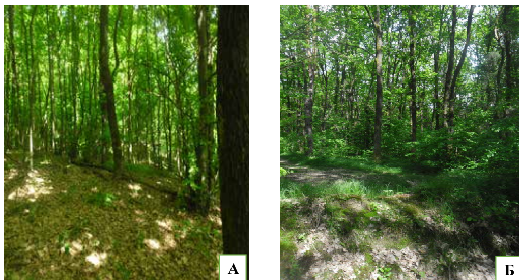
Рис. 2. Угруповання граба звичайного ( Carpinus betulus ) (А) та бука звичайного, або європейського ( Fagus sylvatica ) (Б) у 300-метровій санітарно-захисній зоні Сокирницького родовища цеолітів Хустського району Закарпатської області

Поблизу Сокирницького кар'єру, що належить ПрАТ «ЗАКАРПАТНЕРУДПРОМ», ліси розташовані на висоті приблизно 300 м над рівнем моря, що наочно демонструє ландшафтна карта із зображенням 300-метрової горизонталі (рис. 3).