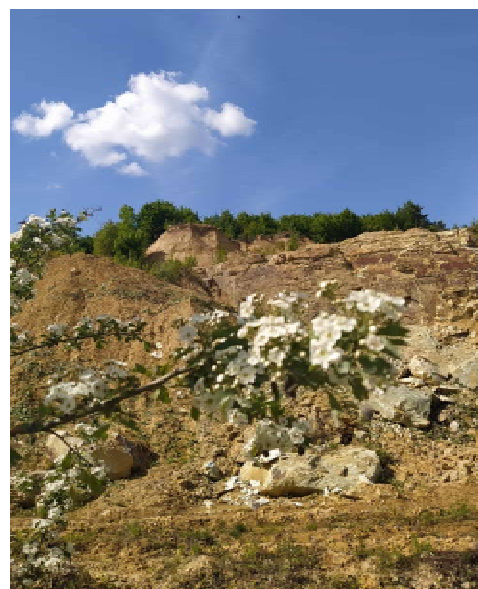
Рис. 1. Сокирницьке родовище (ділянка, розташована між 8 та 11 розрізами) цеолітів ПрАТ «ЗАКАРПАТНЕРУДПРОМ» (загальний вигляд кар'єру)