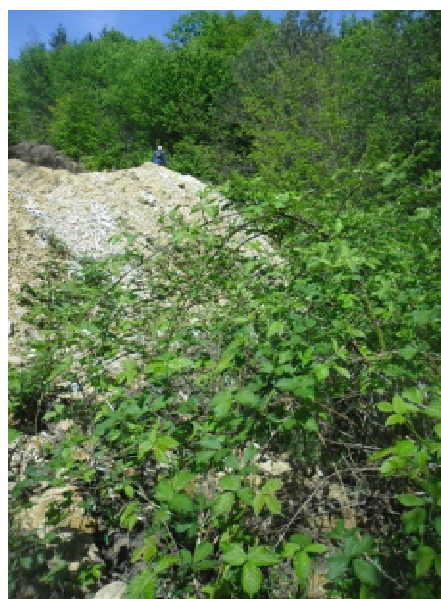
Рис. 5. Грабово-ліщиновий ліс барвінковий ( Carpinetum (betulus) Corileto (avellani) vincosum (minor) ) у 20 м від Сокирницького родовища (ділянка, розташована між 8 та 11 розрізами) цеолітів, скельнодубо-грабовий ліс ожино-вий ( Querceto (petraea)-Carpinetum (betulus) rubosum (hirtus) ) на уступах кар'єру