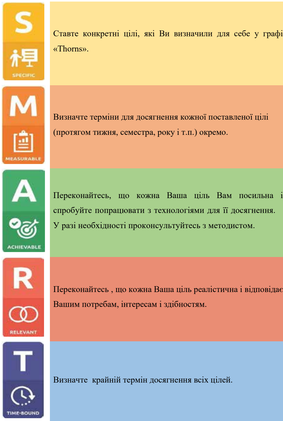
Мал. 3. Планування цілей самоосвітньої компетентності за G. T. Doran (1981) [8, с. 35–36]

Наші спостереження показали, що, як правило, студенти визначають власні індивідуальні цілі у формуванні самоосвітньої компетентності на семестр або навіть на навчальний рік, орієнтуючись на ті предмети і труднощі, з якими вони стикаються під час навчання. Наприкінці семестра / року, методист який працює в групі, пропонує кожному окремому студенту заповнити карту особистісного росту власного рівня професійної самоосвітньої компетентності, яка представлена у таблиці 1.