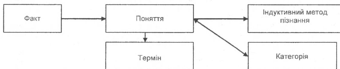
Рис. 1. Система формування власних наукових категорій

Залучення до теоретичного поля соціальної педагогіки категорій і понять суміжних соціогуманітарних наук здійснюється з метою: розширення меж розробки теоретико-методологічної основи науки (предмету дослідження), уточнення її соціально-педагогічних аспектів. Залучення виступає основним механізмом творення власне соціально-