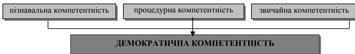
Рис. 4. Очікувані результати громадянського виховання.

адміністративні повноваження і законні процеси. Він повинен володіти стратегічними здатностями, щоб реалізовувати власні чи вірні загальновідомі цілі.