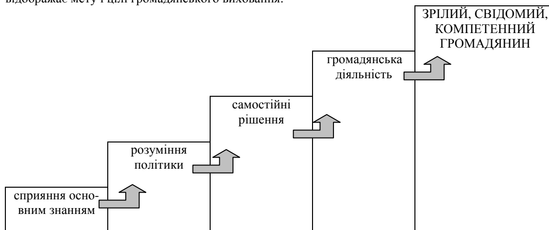
Рис. 2. Мета і цілі громадянського виховання.

Під цільовим компонентом розуміються мета і цілі виховання. Традиційною метою громадянського виховання в Німеччині є формування зрілого, свідомого, компетентного громадянина. Для досягнення цієї мети необхідно реалізувати такі цілі: сприяння основним знанням, розуміння політики, прийняття самостійних рішень та громадянська діяльність. Наступна схема відображає мету і цілі громадянського виховання: