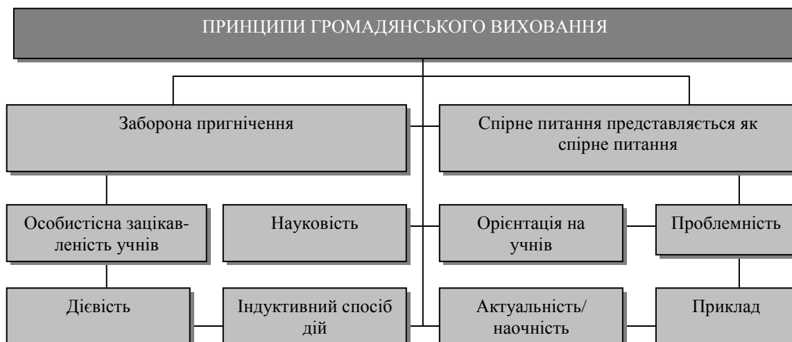
Рис. 3. Принципи громадянського виховання в Німеччині.

Принципи взаємодіють між собою і доповнюють один одного. У залежності від теми на перший план виходять то одні, то інші, жодна тема не поєднує їх всіх. Проте, перші два принципи Бойтельбахської згоди займають провідну позицію при будь-якій тематиці. Громадянське виховання, яке порушує заборону пригнічення або принцип спірного питання вважається не професійним [6].