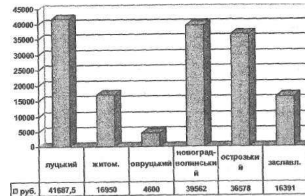
Рис. 14.2. Величина добровільних внесків на розвиток Волинського (Кременецького) ліцею з повітів Волинської губернії у першій третині XIX ст. (у руб.)

Розподіл добровільної підтримки створення Кременецького ліцею серед представників різних повітів Волинської губернії представлено на рис. 14.2.