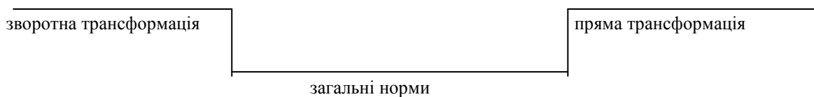
Рис. 1. Процес концептуалізації.

Схематично процес контекстуалізації можна зобразити так на рис. 1.