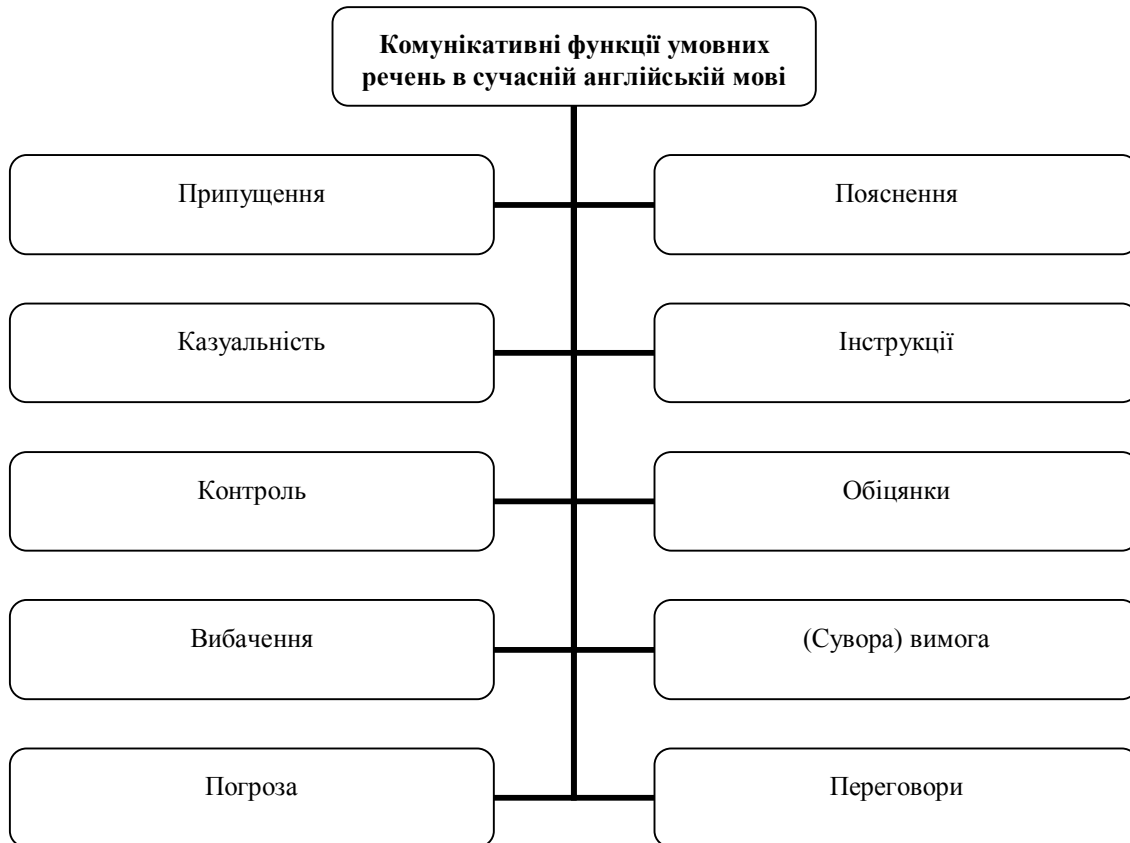
Рис. 2. Комунікативні функції умовних речень в сучасній англійській мові.