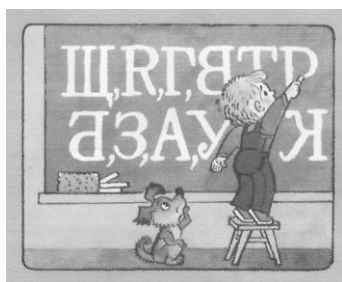
Рис. 1. Завдання із журналу "Малятко"

Які літери хлопчик Дениско написав неправильно? (див. Рис. 1) [13: 10].