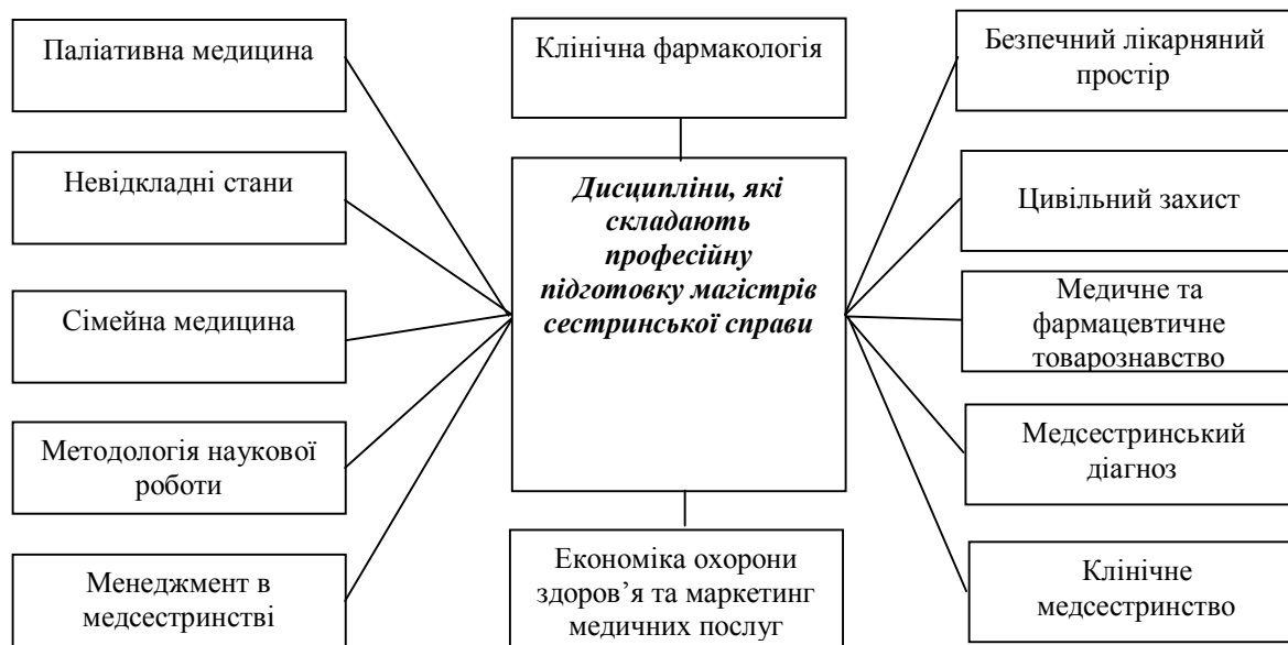
Рис. 2. Дисципліни, які забезпечують професійну підготовку магістрів сестринської справи.

магістрів сестринської справи здійснюється шляхом вивчення курсу "Українська мова (за професійним спрямуванням)". Метою курсу є підвищення рівня загальномовної підготовки майбутніх магістрів, мовної грамотності, комунікативної компетентності студентів, практичне оволодіння основами офіційно-ділового, наукового, розмовного стилів української мови, що забезпечить професійне спілкування на належному рівні, вироблення навичок оптимальної мовної поведінки у професійній сфері: вплив на співрозмовника за допомоги вміння використати різноманітних мовних засобів, оволодіння культурою монологу, діалогу та полілогу; сприйняття і відтворення фахових тестів; засвоєння лексики і термінології свого фаху; вибір комунікативно виправданих мовних засобів; послуговування різними типами словників.