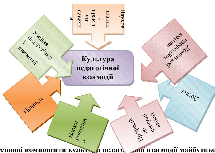
Рис. 1. Основні компоненти культури педагогічної взаємодії майбутнього вчителя іноземних мов

Наявність перелічених компонентів вказує на те, що у культурі педагогічної взаємодії втілюються духовні (педагогічні знання, теорії, концепції, накопичений педагогічний досвід, професійні етичні норми) та матеріальні (засоби навчання та виховання) цінності освіти і виховання, а також способи творчої педагогічної діяльності, які слугують соціалізації особистості у конкретних історичних умовах. Для дослідження культури педагогічної взаємодії як інтегративного поняття важливими є усі складові, оскільки саме їх систематизована сукупність сприяє ефективній педагогічній взаємодії. По суті, компоненти культури педагогічної взаємодії є моделями людських взаємин, механізмом взаємодії із навчальним середовищем, свого роду сценаріями поведінки,