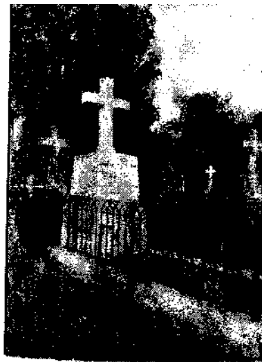
Могила Г.Олізара в Дрездені.

Як відомо, Г.Олізар 14 лютого 1826 року був звільнений з виправдальним атестатом з-під слідства в його рідні краї. І.Г.Ковальов 11 серпня 1826 р. питає О.І.Татишева: "чи можна виїздити Г.Олізару до маєтку його в Крим" і "чи можна допустити його вибрання на посаду предводителя губернського дворянства?" І тут же поспішає довести, що над Г.Олізаром вже встановлено таємний нагляд. 41 В даному випадку не стільки дивне езуїтський характер питань, до цього, очевидно, в Російській імперії встигли звикнути, скільки прагнення випередити події, в даному випадку розпорядження Миколи I,