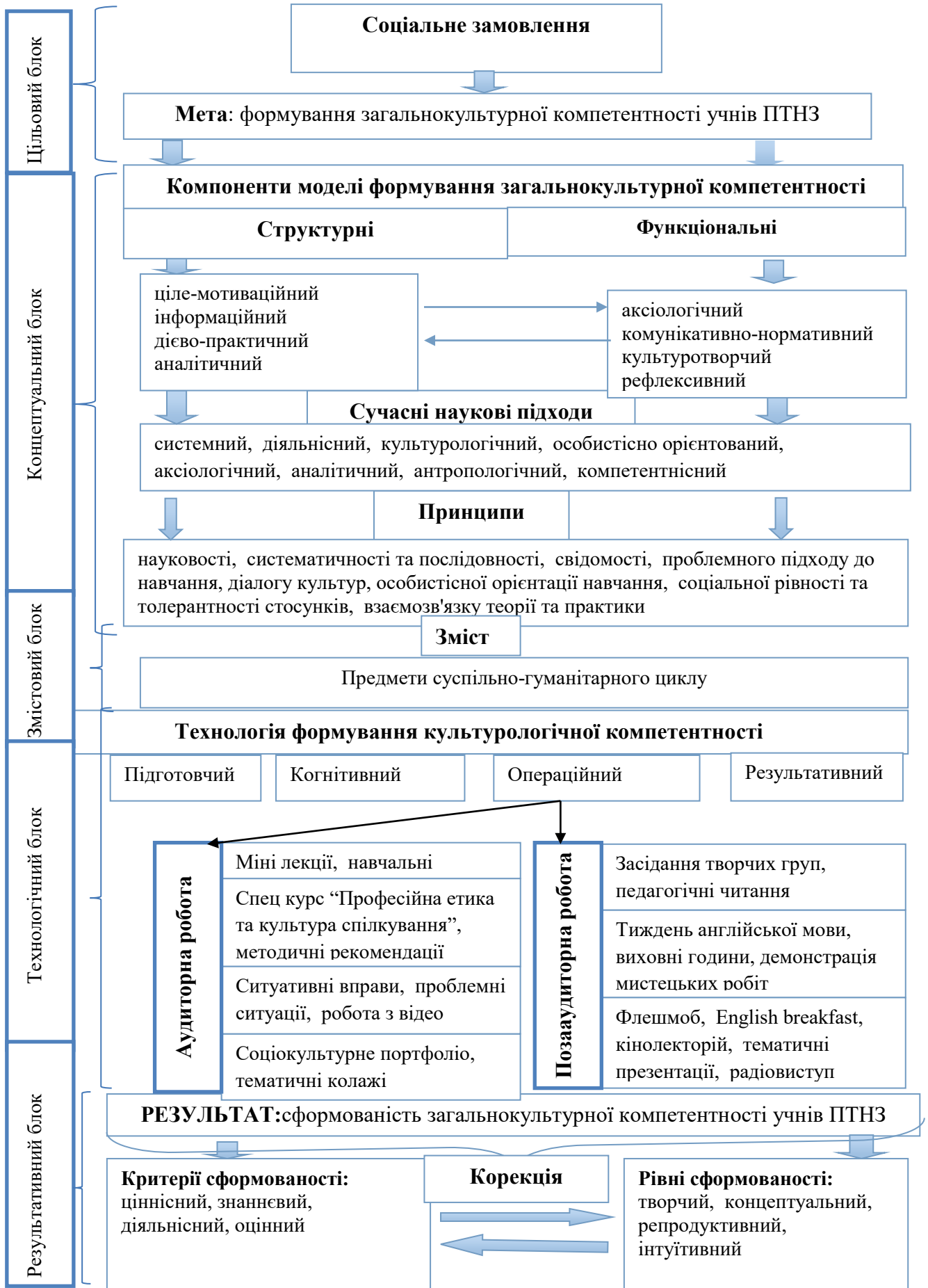
Рис 1. Модель формування загальнокультурної компетентності учнів ПТНЗ