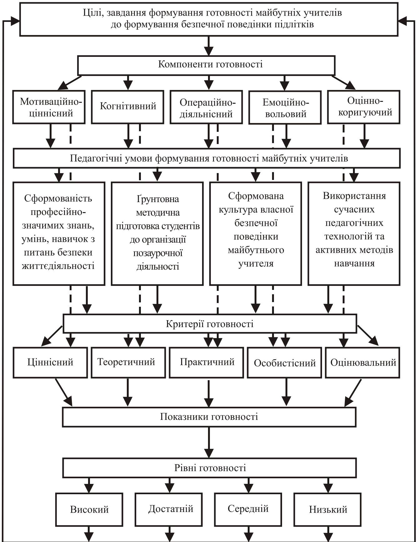
Рис.1. Структурна модель готовності студентів до формування безпечної поведінки підлітків в позаурочній діяльності