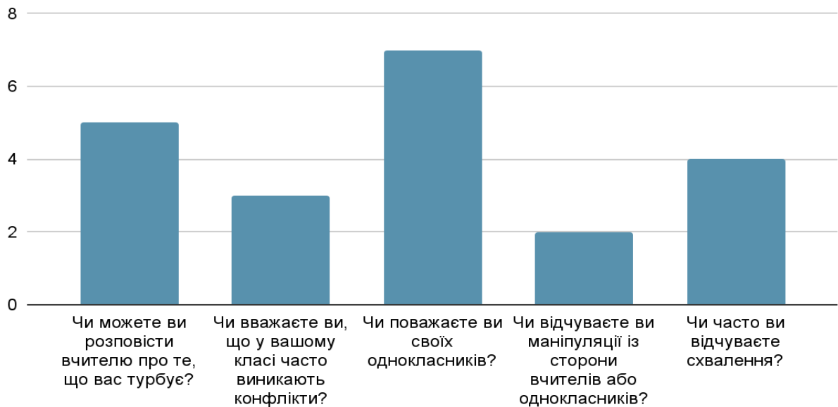
Рисунок 1. Задоволеність якістю міжособистісних взаємин

Як видно з діаграми на рисунку 1, на питання щодо можливості поділитися з вчителем тим, що турбує учня, позитивно відповіли 5 учнів. Отже, половина опитаних учнів мають довіру до вчителя і можуть поділитися з ним своїми переживаннями. Відповіді на питання №2 та №4 свідчать про те, що більшість опитаних респондентів відчувають доброзичливу та толерантну атмосферу в класі.