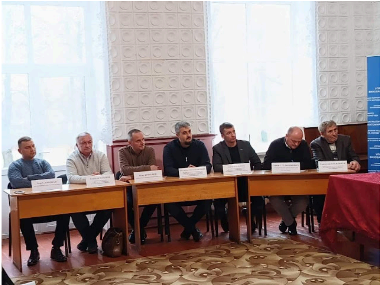
Історичний диспут «Приклад жертвності та звитяги Героїв Базару». Село Базар, 21 листопада 2024 року.

Проявом історичної пам'яті про Другий зимовий похід Армії УНР та Базарську трагедію є їх відображення в документальному кіно. Так, 20 лютого 2019 року було презентовано короткометражний фільм «Другий зимовий похід Армії УНР. Базар», створений на замовлення Управління національно-патріотичного виховання, молоді та спорту Житомирської обласної державної адміністрації в межах акції «Обличчя, що потрібно знати!».