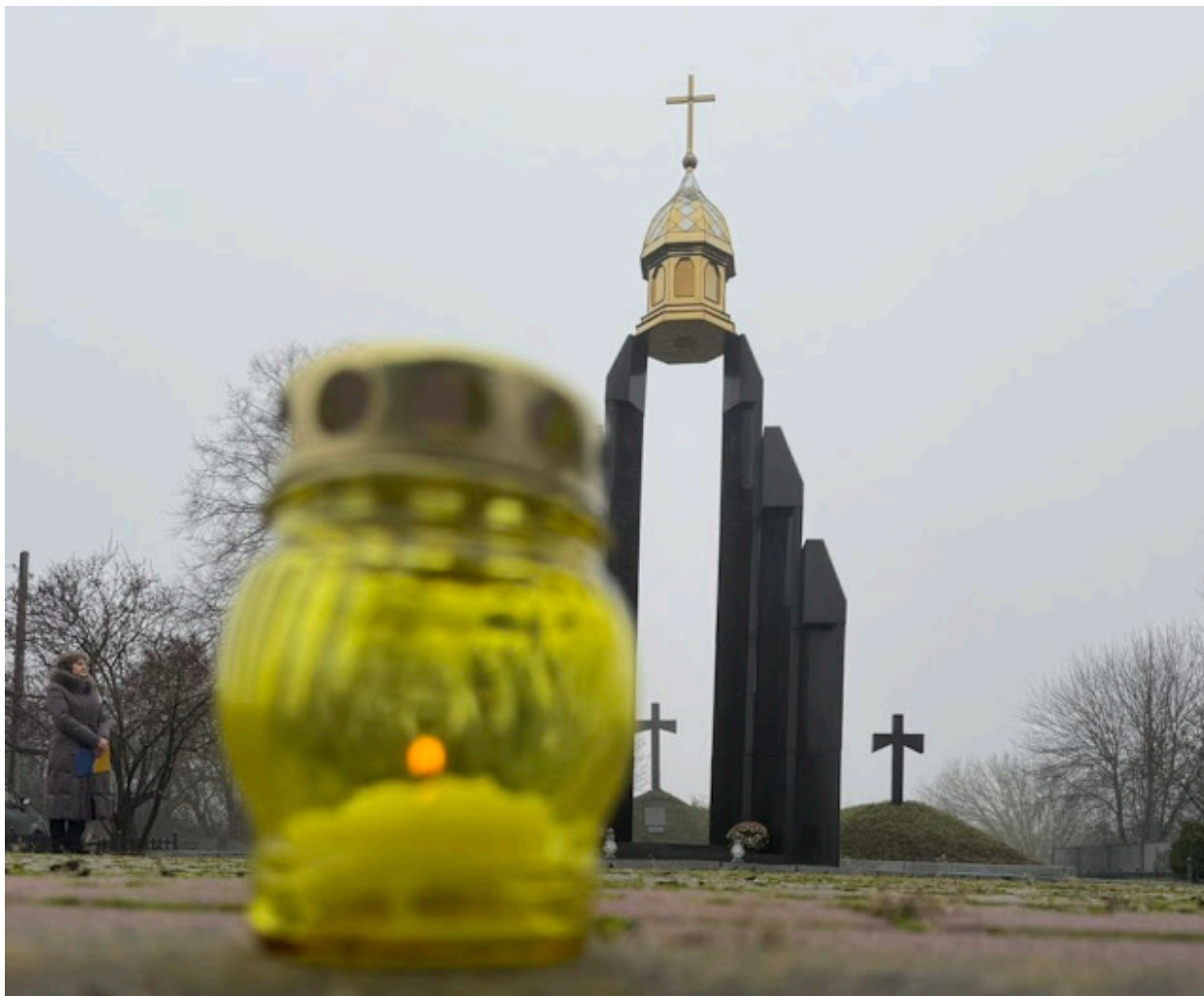
Меморіал Героїв Базару. 21 листопада 2025 року.

У свою чергу, перейменовані під час декомунізації вулиці нерідко пов'язувалися з іменами учасників Другого зимового походу Армії УНР (іноді – з Базарською трагедією), передусім з іменем генерал-хорунжого, керівника Другого зимового походу Армії УНР Юрія Тютюнника, та інших учасників походу. Розпорядженням міського голови Житомира від 19 лютого 2016 року вулиця Войкова була перейменована на вулицю Юрка Тютюнника. Відповідно до розпорядження голови Житомирської обласної державної адміністрації від 20 травня 2016 року вулиці, названі на честь Юрія Тютюнника, з'явилися у м. Овруч (вулиця Юрка Тютюнника замість вулиці Соціалістичної) та с. Жупанівка (вулиця Юрія Тютюнника замість вулиці Жовтневої) Коростенського району на Житомирщині. Також цим розпорядженням у Житомирі вулицю Красовського перейменували на вулицю Героїв Базару. А в с. Болярка Олевського (нині – Коростенського) району вулиця Щорса була перейменована на честь загиблого під час Другого зимового походу Армії УНР уродженця району Леонтія Копнюка.