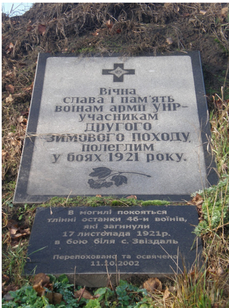
Пам'ятна плита на території Меморіалу Героїв Базару на місці перепоховання останків 46 українських воїнів, загиблих у бою біля с. Звіздаль 17 листопада 1921 року.

Із 2017 року вшанування пам'яті героїв отримало додатковий вимір – через Всеукраїнський фестиваль «Герої Базару». Його мета – популяризація історії українського державотворення та подвигів борців за незалежність та територіальну цілісність України. Серед традиційних заходів, які проводяться під час фестивалю, – історичні диспути. Так, 19 листопада 2017 року та 23 листопада 2018 року на Житомирщині проходили історичні диспути «Другий зимовий похід Армії УНР – спроба відновлення Української державності». 21 листопада 2024 року у с. Базар відбувся історичний диспут «Приклад жертвності та звитяги Героїв Базару»; а 21 листопада 2025 року в с. Базар пройшов історичний диспут «Листопадовий рейд. Другий Зимовий похід».