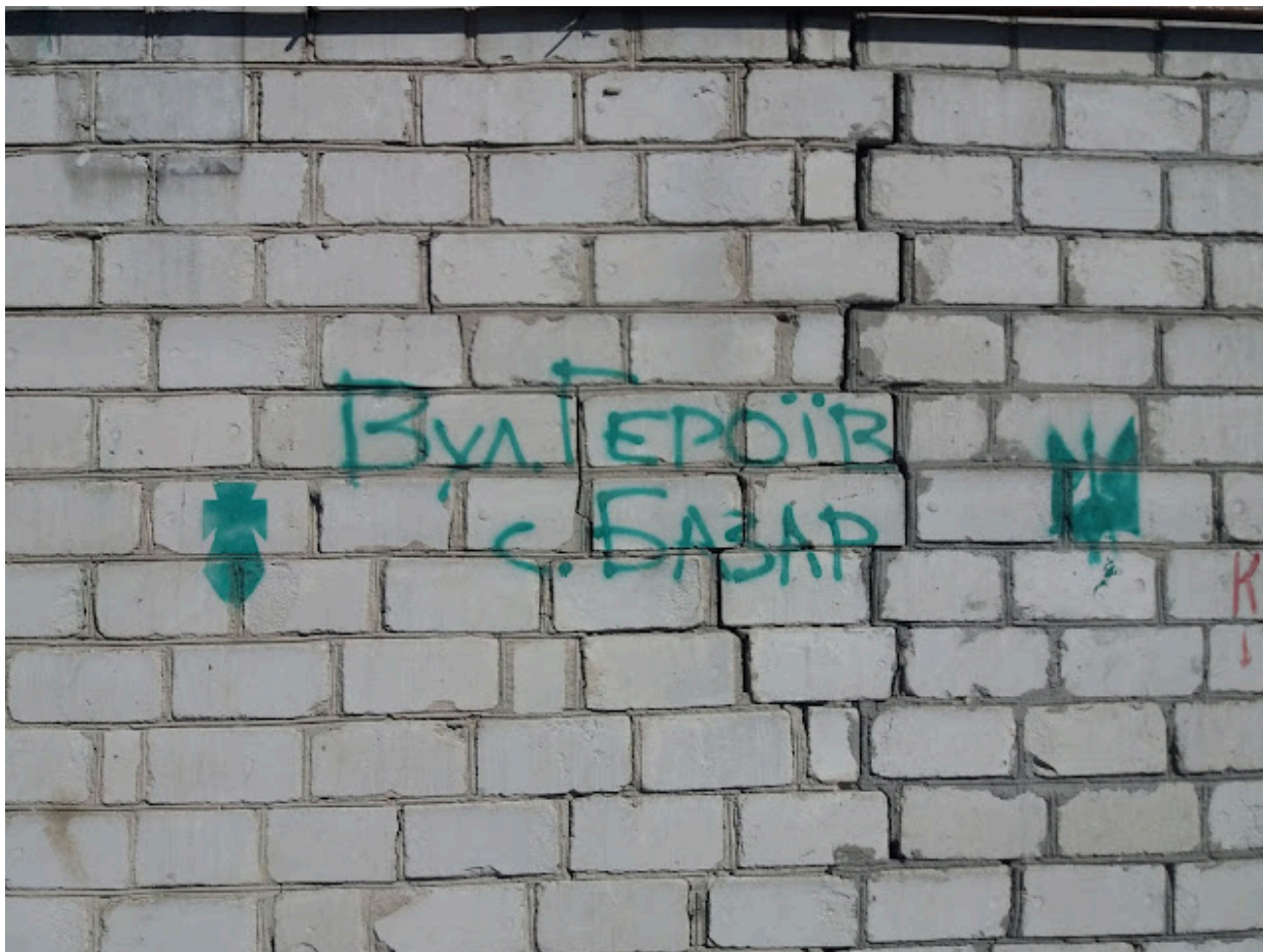
«Додекомунізаційний» період у Житомирі. Напис «Вул. Героїв с. Базар» на одному із будинків по вулиці Котовського.

У Житомирі згідно з розпорядженням міського голови від 19 лютого 2016 року було перейменовано 87 вулиць та провулків, серед яких і вулиця Котовського. Вона була перейменована на вулицю Михайла Грушевського. Упродовж кількох років до цього як прояв своєї «народної декомунізації» на деяких будинках по вулиці Котовського у Житомирі з'являлися написи «Вул. Героїв с. Базар», «Вул. Героїв Базару». Розпорядженням голови Житомирської облдержадміністрації від 20 травня 2016 року були перейменовані вулиці, пов'язані з ім'ям Григорія Котовського, ще у 24 населених пунктах області. У межах декомунізаційних процесів відбувався демонтаж пам'ятників і пам'ятних знаків, присвячених Григорію Котовському. Такий пам'ятник, зокрема, був демонтований 23 листопада 2015 року у Бердичеві.