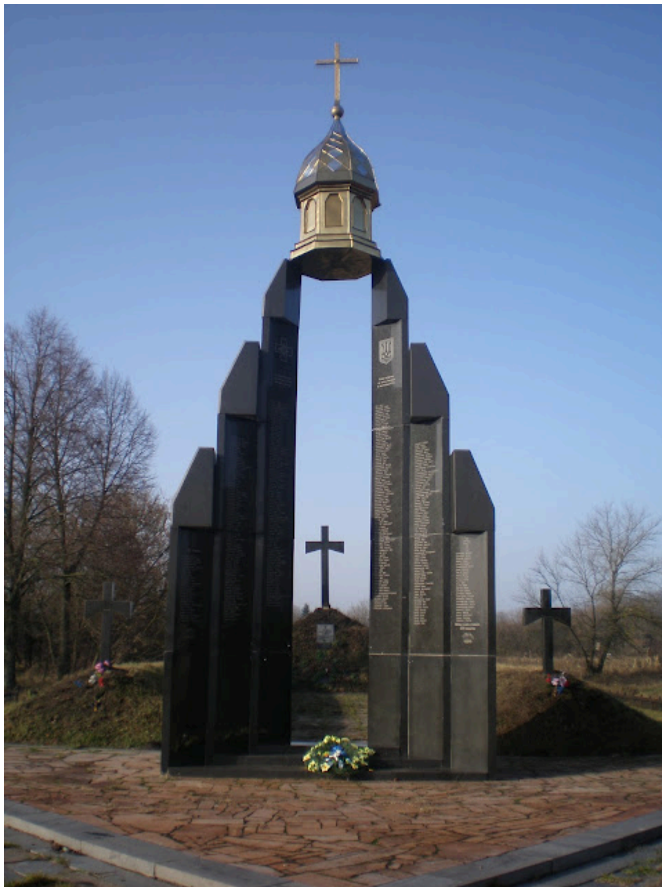
Загальний вигляд Меморіалу Героїв Базару та місць поховань загиблих учасників Волинської групи Другого зимового походу Армії УНР.

Центральним місцем вшанування пам'яті розстріляних більшовиками 21–23 листопада 1921 року українських воїнів у Базарі став Меморіал Героїв Базару (Меморіал пам'яті Героїв Базару) – монумент, зведений за ініціативи голови Об'єднання бувших вояків-українців у Великій Британії Святослава Фостуна на кошти української діаспори. Меморіал урочисто відкрили 26 серпня 2000 року; на його пілонах викарбувано імена всіх похованих. 11 жовтня 2002 року на території Меморіалу перепоховали останки 46 українських воїнів, загиблих у бою біля с. Звіздаль 17 листопада 1921 року.