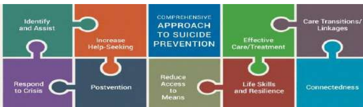
Рис. 1. Комплексний підхід до запобігання суїциду (A Comprehensive Approach to Suicide Prevention).

Дозволимо собі зупинитися на стратегії профілактики в громаді – гейткіпінг. Гейткіпер (анг. брамник, воротар) -це людина , яка має особистий контакт із великою кількістю людей у своїх громадах і покликана виявляти у громадах осіб з ознаками суїцидальної поведінки і скеровувати їх до служ допомоги, тобто це помічник, який здатний надати першу психологічну допомогу людині в суїцидальній кризі.