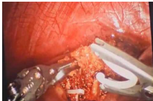
Рис. 5. Етап роботичної резекції печінки. Кліпування жовчних шляхів

Мініінвазивні методи хірургічного лікування, зокрема роботична хірургія, приводять до кращих