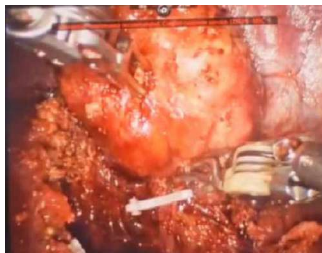
Рис. 6. Завершальний етап роботичної резекції печінки

періопераційних результатів порівняно з відкритими втручаннями в дітей із пухлинами печінки.