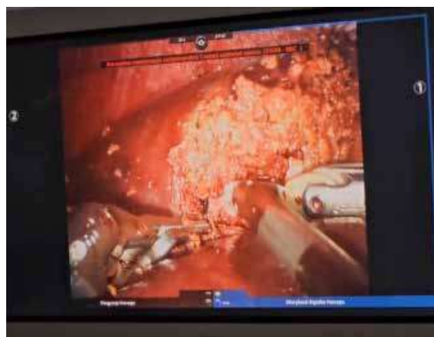
Рис. 4. Фінальний етап роботичної резекції печінки