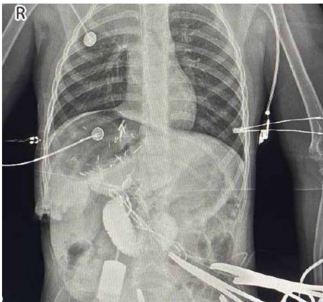
Рис. 1. Прямая інтеропераційна холангіографія

У більшості випадків новоутворення діагностовано випадково (під час планового УЗД).