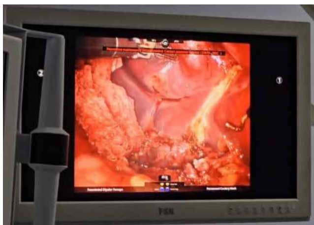
Рис. 3. Фрагмент роботичної резекції п'ятигодинного сегмента печінки

Статистично значущої різниці щодо тривалості операції не виявлено (p=0,08), що, імовірно, пов'язано з невеликою вибіркою.