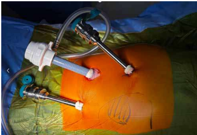
Рис. 1. Положення роботичних трокарів (12 мм «оптичний» у ділянці пупка, два 8 мм «робочих» в епігастрії та лівій здухвинній ділянці)

Проблемою лікування селезінкових кіст є ймовірність рецидиву захворювання, виникнення якого залежить від радикальності видалення утвору [7]. Доцільно вважати парціальну спленектомію оптимальним методом ліквідації кіст селезінки, що пояснюється збереженням частини неураженої тканини органа відповідно до його функцій і повним висіченням кістозної порожнини з навколишньою паренхімою. Усе більшої популярності набувають мініінвазивні втручання при захворюваннях селезінки [5]. Роботичні платформи дають змогу кваліфікувати пацієнтів із наведеною патологією до роботичних оперативних втручань [3,6].