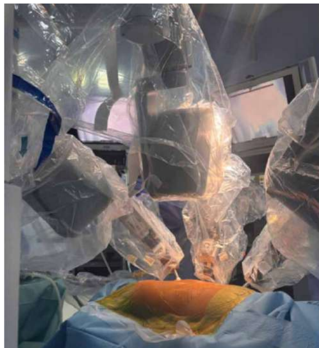
Рис. 2. Вигляд робочої поверхні після проведення «докінгу»

Для оцінювання відмінностей між групами застосували t-критерій Стьюдента для незалежних