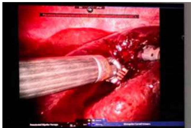
Рис. 4. Парціальна резекція частки селезінки з кістою