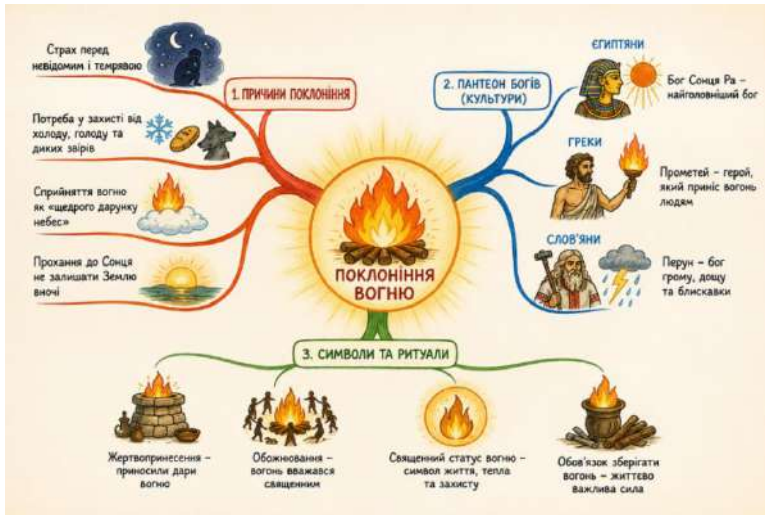
Рис. 4. Ментальна карта до тексту «Поклоніння вогню»

ментальної карти або кластера . Оскільки в ньому згадується багато різних культур (греки, єгиптяни, слов'яни) і природних стихій, така візуалізація допоможе систематизувати знання про вірування давніх людей. У центрі карти зображується Вогонь або Сонце, як головний символ життя та захисту.