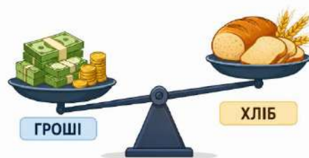
Рис. 3. Інфографіка «Терези інфляції»

Окрім наведених прикладів текстів, підручник для 2 класу подає в простій і зрозумілій формі деякі поняття, що стосуються економіки нашої держави та описані в тексті під назвою: «Чому грошей не може бути скільки завгодно?» . Для пояснення терміну «інфляція» та відповідного текстового супроводу використаємо метод інфографіки . Візуалізація «Терези інфляції» (рис. 3)