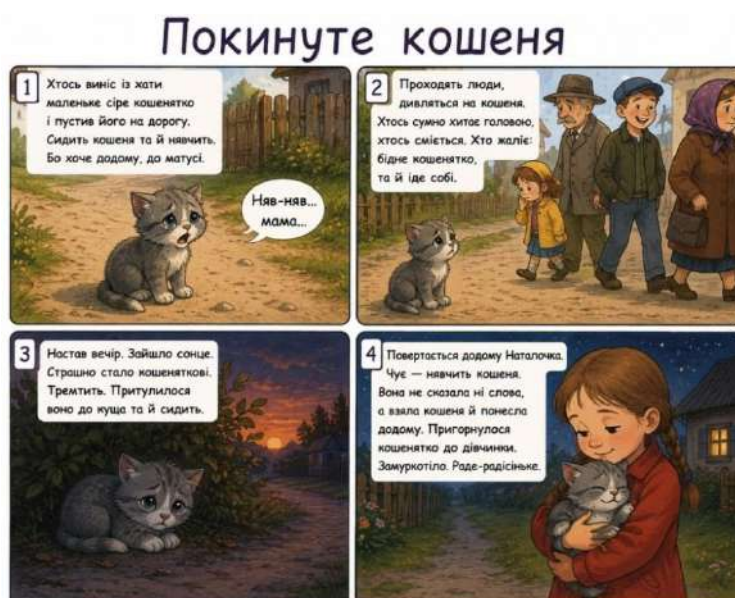
Рис. 2. Візуалізація-комікс до казки «Покинуте кошеня»

Наступним розглянемо метод коміксу як інструмент візуалізації оповідання «Покинуте кошеня». Вибір цієї технології зумовлений її здатністю фрагментувати сюжет на ключові емоційні вузли, що дозволяє детально проаналізувати зміну настрою