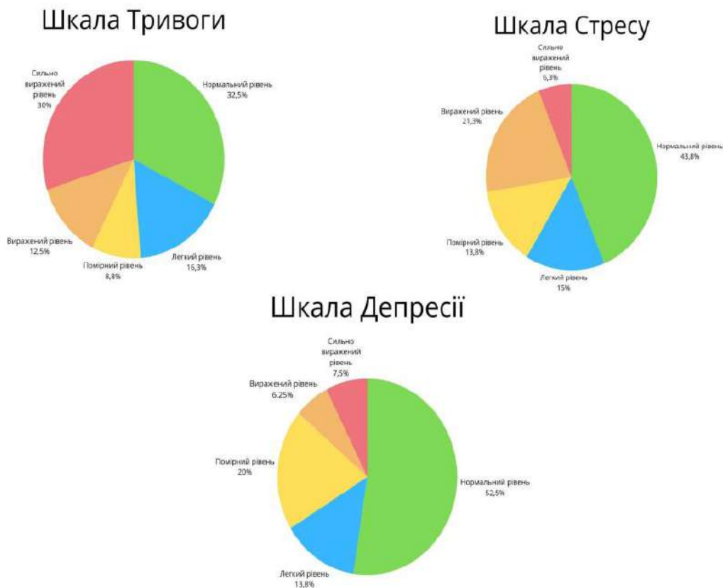
Рис. 2. Відсотковий розподіл рівнів вираженості депресії, тривоги та стресу

За шкалою тривоги ситуація критична: норма зафіксована лише у 32,5%, тоді як легкий рівень мають 16,25%, помірний – 8,75%, виражений – 12,5%, а сильно виражений – 30% (24 особи). Нормальний рівень стресу притаманний 43,75% учнів, легкий – 15%, помірний – 13,75%, виражений – 21,25%, сильно виражений – 6,25% (див. Рис. 2).