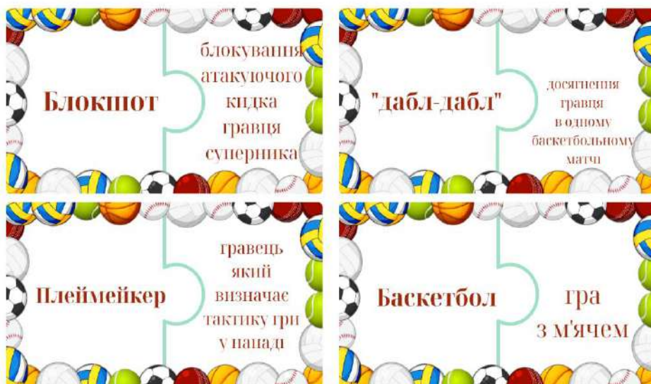
Рис. 1. Баскетбольні пазли

Ситуативні завдання , в яких учасники дослідження знаходили рішення, аналізували власні дії та інших учасників, допомагали один одному в прийнятті рішень і плануванні дій: «Баскетбольні пазли» (рис. 1.), «Відгадай правило з баскетболу», «Баскетбольний Квест», «Комунікація і співпраця».