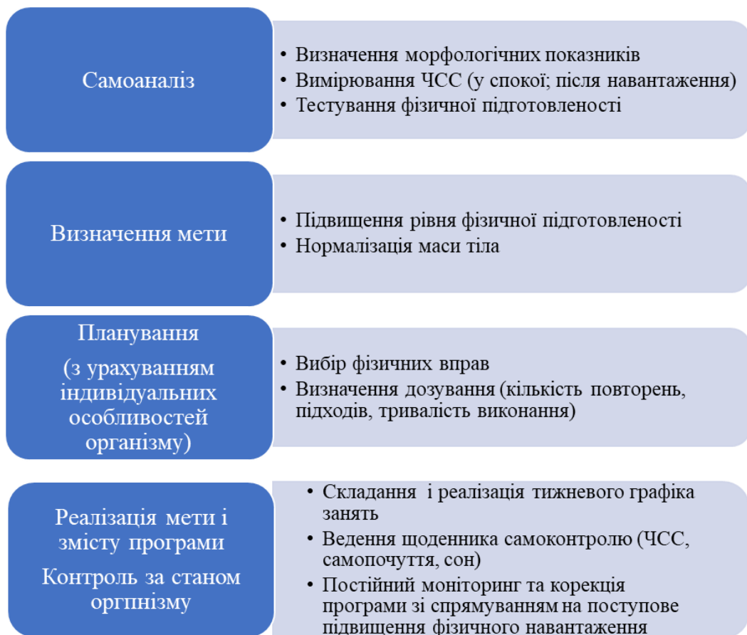
Рис. 3. Етапи розробки індивідуальної оздоровчої програми

Процес розробки програми структуровано за чотирма основними етапами, що забезпечують логічну послідовність від діагностики до практичної реалізації.