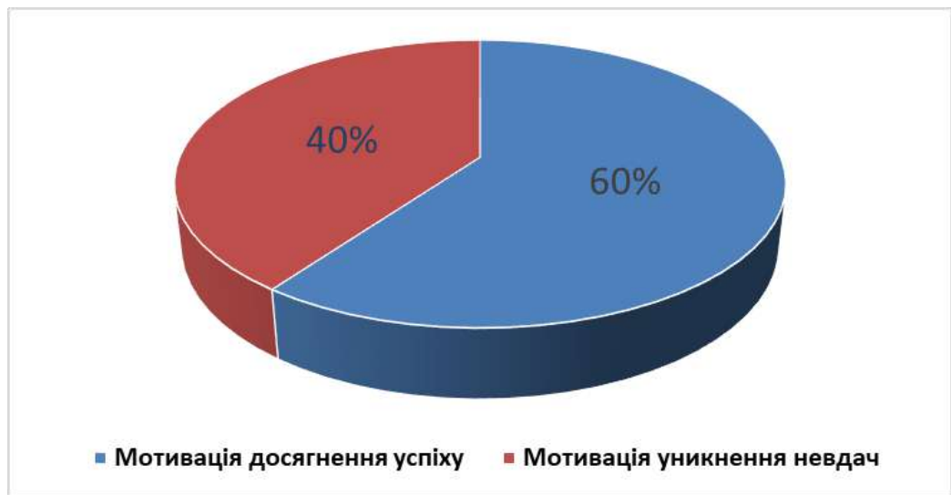
Рис 2. Показники мотивації досягнення стрибунів у висоту з розбігу (за методикою Т. Елерса)

Перевага мотивації досягнення успіху є позитивним стимулом для спортивного вдосконалення, проте високий відсоток спортсменів з орієнтацією на уникнення невдач потребує впровадження спеціалізованих засобів психологічної корекції у тренувальному процесі, спрямованих на підвищення впевненості у власних силах і подолання страху поразки в процесі подолання висоти.